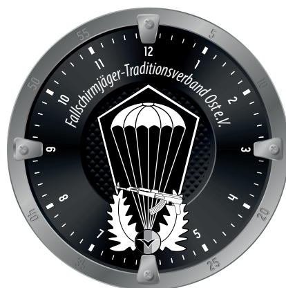
Motiv 7 Verbandsuhr