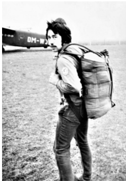
Als GST-Kamerad in Leipzig-Mockau 1973 schon mit RS 4/3

Mit dem Kopf nach unten in 800 Meter Höhe und die Beine gefesselt, das war kein wirklich angenehmes Gefühl. Es gelang mir aber bis in ca. 200 Meter Höhe mich aus dieser Lage zu befreien und normal zu landen. (Außenlandung Rapsfeld).